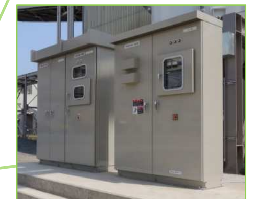
動力盤・制御盤(現場)